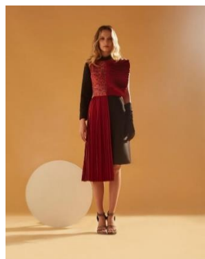
คอลเลคชั่น 2