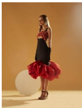
คอลเลคชั่นที่ 1

เหมาะสมและส่งเสริมภาพลักษณ์ของผ้าไหมแพรวา ( \bar{X} = 4.24 ) สีและลายที่มีความกลมกลืนและสอดคล้องกับแนวโน้มนแฟชั่น ( \bar{X} = 3.94 ) ผ้าและวัสดุที่นำมาใช้ในการออกแบบมีความเหมาะสม ( \bar{X} = 3.74 )