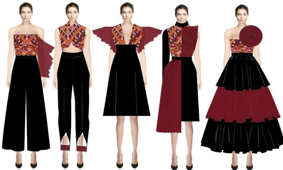
ภาพที่ 3 การออกแบบโครงร่างและการลงสีคอลเลคชั่นที่ 2