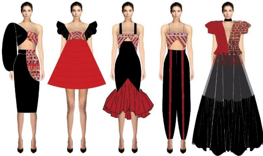
ภาพที่ 2 การออกแบบโครงร่างและการลงสีคอลเลคชั่นที่ 1

โดยนำโครงร่างของวัสดุและอุปกรณ์ทอผ้าไหมแพรวา ได้แก่ รังไหม กระดิ่งเลี้ยงไหม เครื่องกรอผ้า กระจวย กี่ทอผ้า มาวิเคราะห์โดยดึงลักษณะที่เป็นจุดเด่นและเป็นเอกลักษณ์ของโครงร่างที่แสดงรูปทรงที่ชัดเจนมาใช้เป็นแนวทางการออกแบบโครงร่างเครื่องแต่งกาย ร่วมกับการศึกษาแนวโน้มแฟชั่น 2020 โดยนำเสนอกลุ่มสีในฤดูร้อนมาประยุกต์ใช้มุ่งนำกลุ่มสีแดงมาประยุกต์ใช้ให้มีความสอดคล้องกับอัตลักษณ์ของผ้าไหมแพรวา ทำการพัฒนาปรับเปลี่ยนให้มีความเหมาะสมกับการใช้งานสำหรับกลุ่มสตรีวัยทำงานช่วงอายุระหว่าง 25 -35 ปี โดยกำหนดเป็นชุดปาร์ตี้แวร์จำนวน 2 คอลเลคชั่น ดังภาพที่ 2 และภาพที่ 3