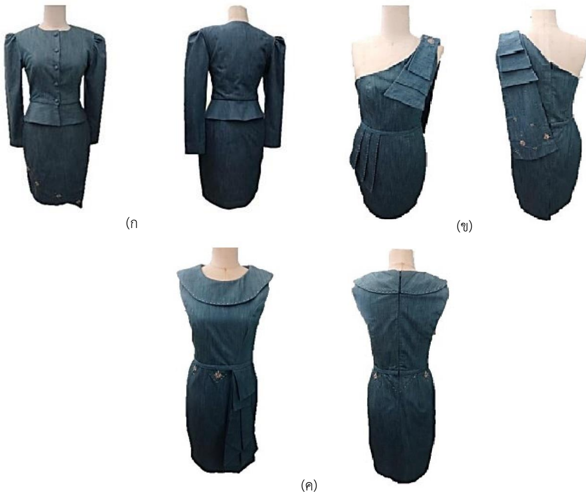
ภาพที่ 5 ชุดไทยร่วมสมัยสำหรับวัยรุ่นสตรีจากผ้าเดนิม (ก) ชุดไทยร่วมสมัยดัดแปลงจากชุดไทยเรือนต้น (ข) ชุดไทยร่วมสมัยดัดแปลงจากชุดไทยจักรี และ (ค) ชุดไทยร่วมสมัยดัดแปลงจากชุดไทยดุสิต

พบว่าชุดไทยดัดแปลงจากชุดไทยเรือนต้น แบบที่ 1 ชุดไทยดัดแปลงจากชุดไทยจักรี แบบที่ 2 ชุดไทยดัดแปลงจากชุดไทยดุสิต แบบที่ 2 ได้รับการเลือกจากผู้เชี่ยวชาญคิดเป็นร้อยละ 100 67 และ 67 ตามลำดับ ดังแสดงในภาพที่ 4 หลังจากได้แบบที่ผู้เชี่ยวชาญคัดเลือกแล้วคณะผู้วิจัยได้ทำการสร้างแบบตัดและตัดเย็บตามแบบ ดังแสดงในภาพที่ 5 ซึ่งจะเห็นได้ผ้าเดนิมที่นำมาตัดเย็บเป็นชุดไทยร่วมสมัยสำหรับวัยรุ่นสตรีนั้นมีเนื้อปานกลางทำให้สามารถเย็บเข้ารูปทรงได้เป็นอย่างดี รวมทั้งสามารถจับจีบได้อย่างสวยงาม ดูไม่เทอะทะหรืออึดอัดเวลาสวมใส่ซึ่งอาจเกิดขึ้นได้กับผ้าเดนิมที่มีน้ำหนักผ้ามาก [11]